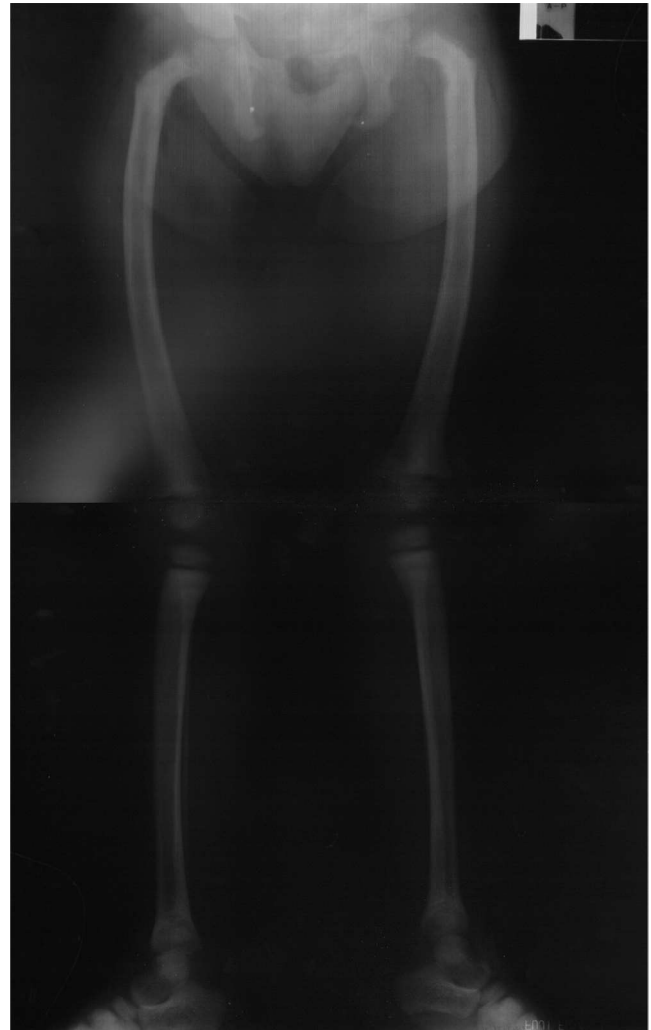
Figura 2. Radiografia dos membros inferiores, efectuada antes do início do tratamento com paricalcitol, revelando deformidades ósseas semelhantes às observadas no raquitismo: arqueamento dos fêmures e joelhos valgós.

O valor do fósforo sérico foi controlado através da manipulação dietética, associada a administração de quelantes (carbonato de