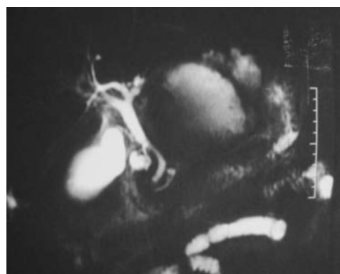
Figura 2. Imagem de ressonância magnética hepato-biliar. Destacam-se na porção esquerda da área hepática 2 coleções líquidas, que são os abscessos hepáticos localizados no lobo esquerdo do fígado.

punção ecoguiada dos abscessos, que permitiu a sua drenagem, com saída imediata de 100 ml de líquido purulento (fig. 4). A análise bacteriológica do líquido foi negativa. A realização de várias hemoculturas revelou a presença de S. intermedius . O doente estava medicado, inicialmente, com tazobactan. Devido a continuação do estado febril, a terapêutica antibiótica foi substituída por imepenem + metronidazol. Após o resultado da cultura e de acordo com o antibiograma, a antibioterapia foi ajustada para clindamicina e cefotaxina. O doente melhorou clinicamente, as análises normalizaram e teve alta hospitalar. Cerca de um mês depois foi feita tomografia axial computadorizada abdominal de controlo, que revelou imagem de loca com 5,5 cm sem qualquer conteúdo (fig. 5). Após 6 meses a ecografia abdominal revelou um fígado sem as locas atrás referidas .