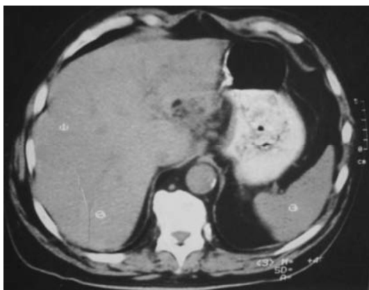
Figura 5. Imagem de tomografia axial computadorizada abdominal feita cerca de um mês após a alta do paciente com abscesso hepático piogénico. Observa-se uma pequena cavidade hepática perihilar. Trata-se de um remanescente do abscesso em fase de resolução.