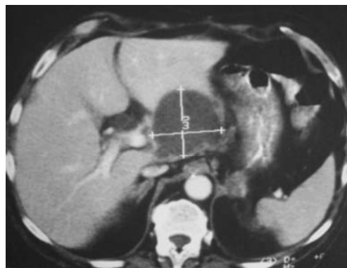
Figura 1. Imagem de tomografia axial computadorizada abdominal. Observa-se um volumoso abscesso hepático perihilar com cerca de 7 cm de diâmetro.

Indivíduo de 54 anos de idade, masculino, caucasiano , foi internado por epigastralgia intensa, anorexia, febre, distensão abdominal e diarreia. O doente era diabético tipo 2 obeso, com bom controlo glicémico , operado ao estômago (tumorectomia) por um tumor do estroma gástrico 3 meses antes . Referia que o quadro se tinha iniciado há 2 dias. A palpação abdominal era muito dolorosa, sobretudo nos quadrantes superiores, sem sinais de irritação peritoneal. As análises revelaram Hb 14,3, leucócitos 17.200/ul neutrófilos 87%, glicémia 7,5 mmol/l, creatinina 123 mmol/l, bilirrubina total 16,4 mmol/l, transaminase glutâmica oxalacética (GOT) 109 U/L, transaminase glutâmica pirúvica (GTP) 121 U/L, gama glutamil transpeptidase (GGT) 205 U/L e fosfatase alcalina (FA) 321 U/L e desidrogenase láctica (LDH) 452 U/L. A ecografia abdominal revelou dilatação das vias biliares intra e extra-hepáticas e imagens hipocogénicas não esclarecidas (fig. 1). A endoscopia digestiva alta confirmou a cirurgia gástrica , sem lesões. A tomografia axial computadorizada (fig. 2) e a ressonância magnética colangio pancreática (fig. 3) mostraram duas volumosas formações abcedadas com nível líquido, uma de 7,2 × 6,2 cm, perihilar e outra de 4 × 4 cm no lobo esquerdo do fígado. Foi feita