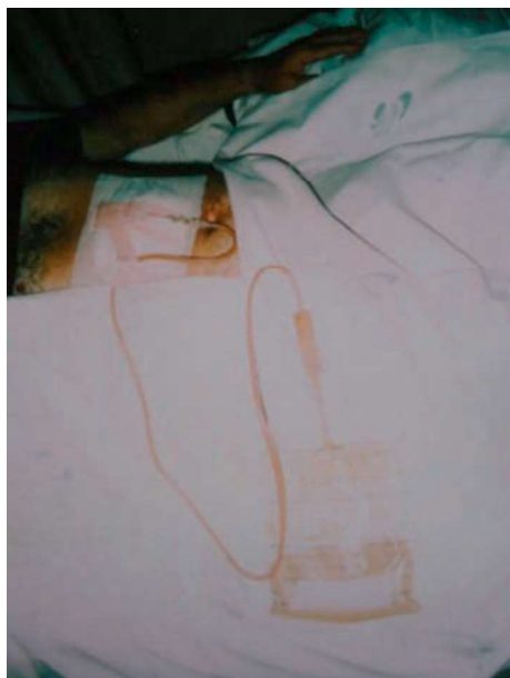
Figura 3. Fotografia mostrando a drenagem percutânea do abscesso hepático. Observa-se a presença de líquido purulento no tubo de drenagem e no saco coletor. A cultura do material purulento foi negativa.