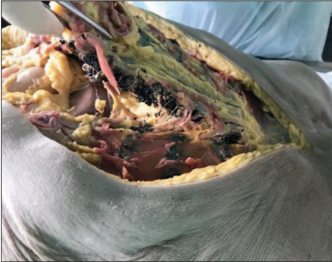
Figura 3. Costelas com tonalidade cinza escura sobretudo na superfície de corte.

Esta patologia relaciona-se com a alteração do metabolismo da fenilalanina e tirosina, causada pela mutação do gene HGD, o que conduz ao acúmulo do ácido homogentísico (HGA) nos tecidos e sua eliminação urinária, podendo este composto promover a oxidação, alterações metabólicas locais e lesão mecânica com degeneração dos tecidos afetados. 1,2