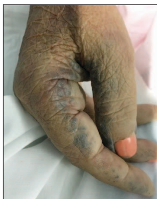
Figura 1. Área de escurecimento dérmico na mão

Ao exame objetivo destacava-se a prostração, cianose labial, coloração dérmica escura com manchas no dorso das mãos ( Fig. 1 ) e orelhas, sopro sistólico grau IV/VI, fervores pulmonares, edema dos membros inferiores e urina escura.